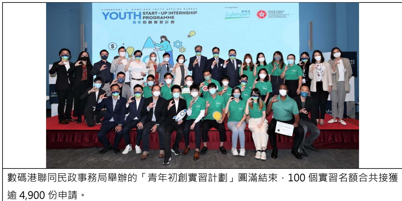
數碼港聯同民政事務局舉辦的「青年初創實習計劃」圓滿結束，100 個實習名額合共接獲逾 4,900 份申請。