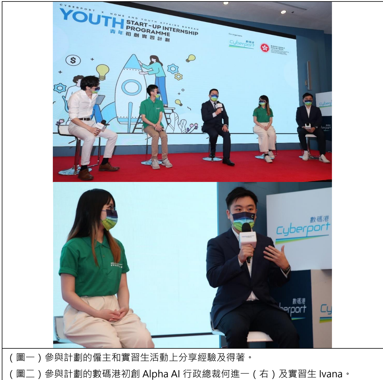
(圖一) 參與計劃的僱主和實習生活動上分享經驗及得著。