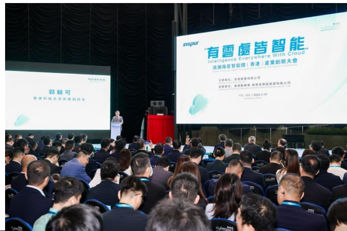
今日活動聚集多個行業夥伴出席，場面盛大。