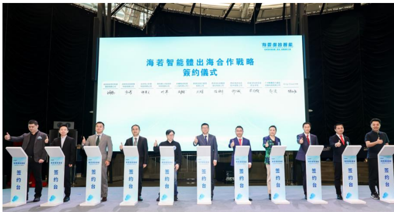
浪潮雲與香港生成式人工智能研發中心（HKGAI）及 20 家夥伴企業簽署戰略合作。